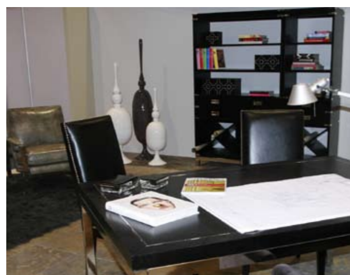
"Hibridación y materiales reusables" Erika Winters Las propuestas de Erika Winters parten de la reinterpretación de muebles de antaño convertidos a base de imaginación y trabajo de diseño, en piezas espléndidas y únicas.