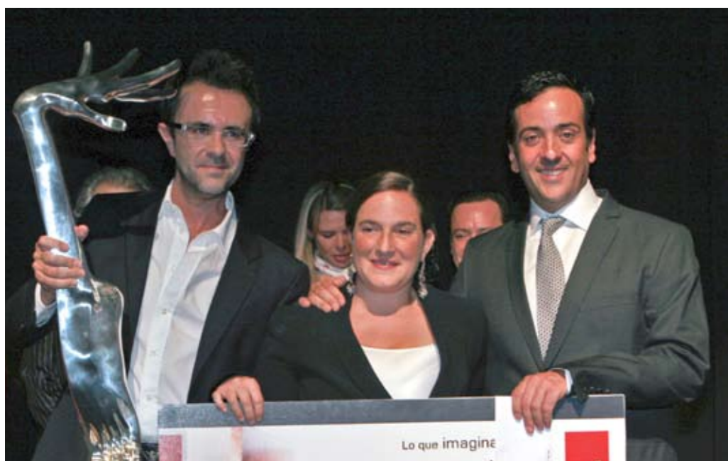
C Cubica, Ganadores del AMDI 2010