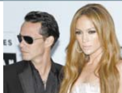
IAN LANGSDON / EFE

Estrellas del mundo del cine y la música, entre ellas Jennifer López y Benicio del Toro, recaudaron la noche del jueves en Cannes varios millones de dólares para la lucha contra el SIDA en la gala-subasta de AMFAR. En la cena, el ex presidente de Estados Unidos, Bill Clinton, subastó una jornada con él. Se remataron además vestidos de Armani o participar en el bautizo de un avión con Russell Crowe. (NTX)