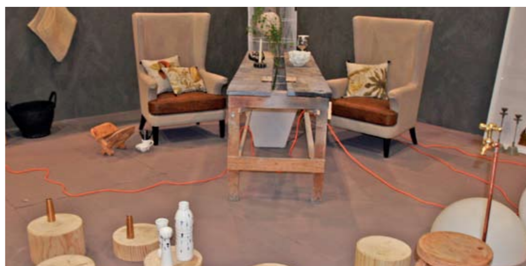
"Back to basics" Muro Rojo Fundado con la intención de integrar la arquitectura, interiorismo, paisajismo y el arte dentro de un mismo espacio, bajo la convicción de que las tendencias hoy en día recaen en el rehízo de formas, estilos y objetos a partir de su descontextualización, es decir, volver la mirada hacia el origen, logrando mantener un ambiente sustentable.