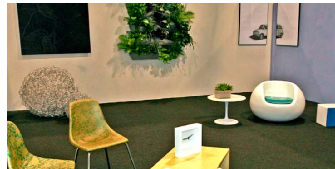
"Obra Hibrida" Acceso B, Galería Este grupo tiene la finalidad de promover principalmente artistas emergentes, jóvenes que tengan propuestas visuales de alta calidad y aun no acceden al mercado del arte, expresó que las tendencias en el arte contemporáneo están regidas por múltiples variables que van desde el mercado hasta aspectos individuales y culturales.