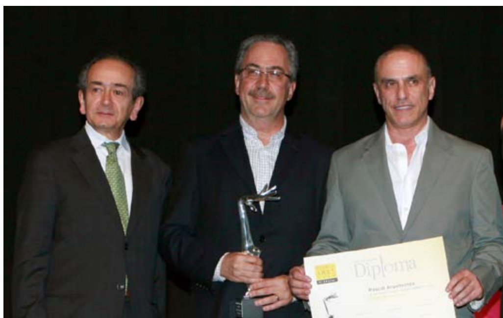
Pascal Arquitectura, Ganador de la categoría Turística