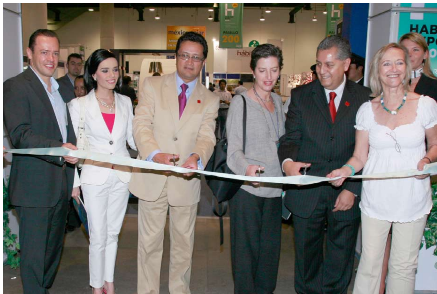
Inauguración Habitat Expo 2010

Entre las actividades que se desarrollaron para festejar su décimo aniversario, se exhibió el Pabellón "Tendencias Habitat", donde arquitectos, diseñadores de interiores, diseñadores industriales, paisajistas y galerías, plasmaron su propuesta de las tendencias del mercado desde su propia perspectiva, utilizando los productos que se presentaron en el evento. También se contó con el Pabellón +Diseño, las jornadas de casos de éxito, la lva ceremonia de premiación de Premio Nacional de Interiorismo y la segunda edición de los Premios Promesas México.