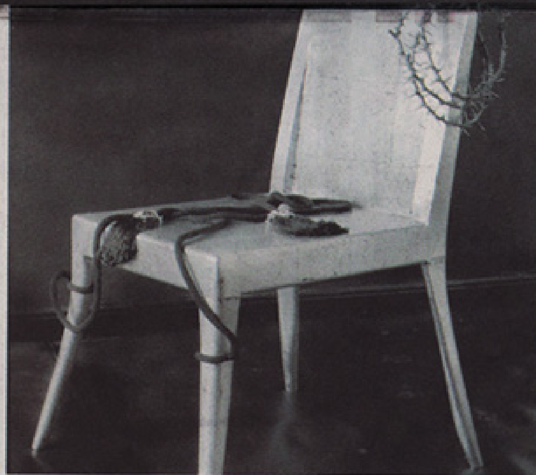
FLAGELO. Cuerdas para atarse y una corona de espinas componen la pieza

"Reflexioné mucho sobre cuál podría ser el objeto fetiche que represen-