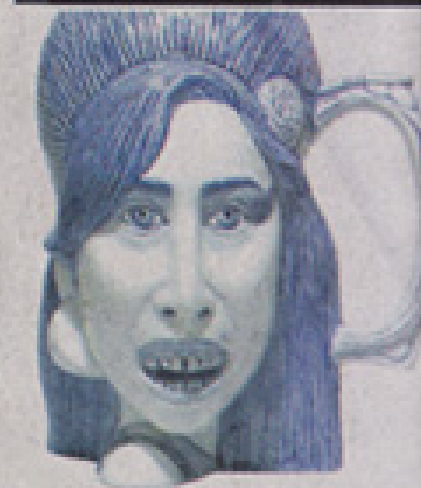
OTROS. Más obras de la exposición

a reflexionar; también está ins en El pensador de Rodin y en el de La Divina comedia .